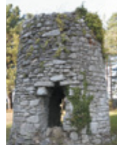
La Masse de Tréveday, ancien moulin-turquois

A proximité du faubourg Saint-Michel, le lieu-dit de La Place, appartenant à la seigneurie des Régaires* de l'évêque de Nantes, comptait six moulins à l'époque moderne.