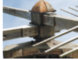
Croisement des ailes à voiles