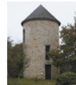
Moulin-tour de Bouzeray

L'invention du système Berton au cours du 19 e siècle révolutionne la meunerie. Les ailes, composées de longues planches en bois, s'ouvrent mécaniquement grâce à un système installé à l'intérieur du moulin. Le meunier n'ayant plus besoin de monter sur les ailes, les moulins sont rehaussés pour aller chercher des vents plus puissants. D'anciens moulins se voient relevés d'un étage. C'est notamment le cas du moulin-tour de Beaulieu construit au 16 e siècle. Le moulin à petit-pied de Careil connaît la même destinée : sa cage est rehaussée de deux étages. Cela donne naissance à une nouvelle forme de moulin appelée moulin « grosse-tête », la partie supérieure en encorbellement étant plus haute que le pied.